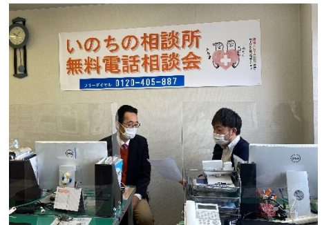
積理事長も、激励で訪問される。