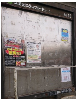
コミュニティボードに掲示