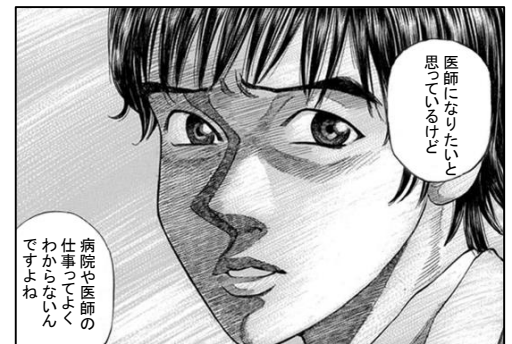
タイトル: ブラックジャックによろしく 著作者名: 佐藤秀峰

くわみず病院(熊本市:内科系)・菊陽病院(菊陽町:精神科)・水俣協立病院(水俣市:内科系)では医師を目指す高校生の皆さんを対象に1日医師体験を行っています。現場で働く職員や患者さんと触れ合ってみませんか？